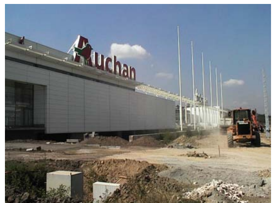
Auchan, Savoya Park, Budapest