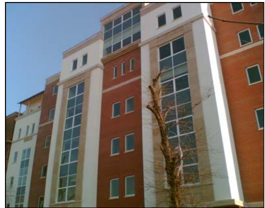
Bajcsy Zsilinszky kórház, Budapest