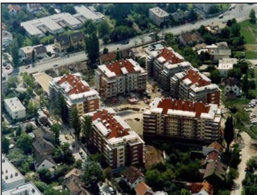
Tölgyes lakópark, Budapest