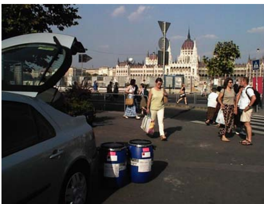
Batthyány téri metro megálló